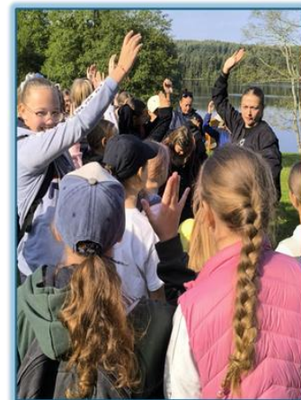
Dainai! Dainai! Dainai! Dainai! Dainai! Dainai! Dainai! Dainai! Dainai!