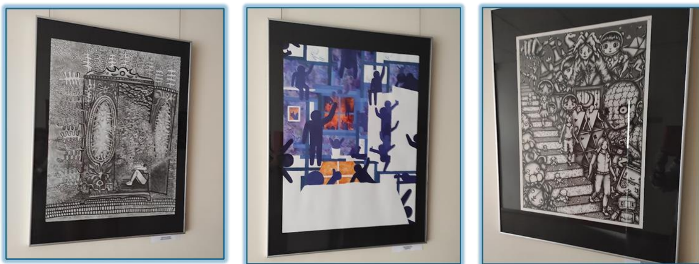
Dainai Dainai Dainai Dainai Dainai Dainai Dainai Dainai Dainai Dainai Dainai Dainai Dainai Dainai Dainai Dainai Dainai Dainai Dainai Dainai Dainai Dainai

Progimnazijoje eksponuojama Šiaulių Juliaus Janonio gimnazijos dailės studijos „Koloritas“ paroda „Aš kaip šizofrenijos spinta“. Įdomūs, neįprasti, verčiantys susimąstyti apie egzistencinę prasmę, laikinumą parodos darbai ne vieną nustebino, net šokiravo, bet abejingų tikrai nepaliko.